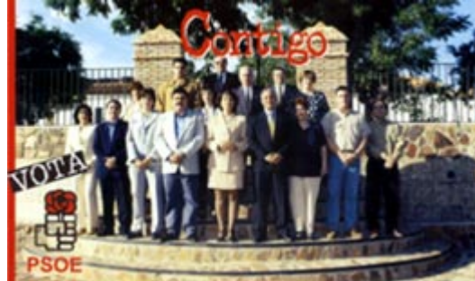
PARTIDO SOCIALISTA OBRERO ESPAÑOL