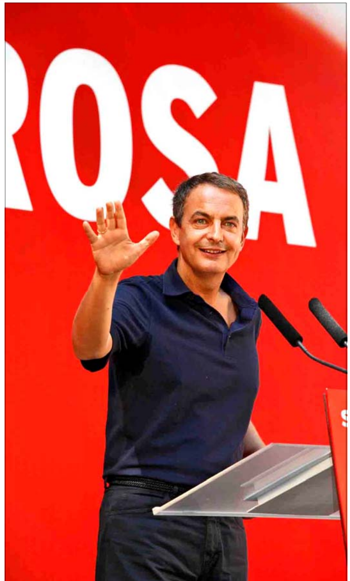
Rodríguez Zapatero, durante su intervención en la fiesta del PSC

“Por qué dicen que es electoralismo cuando tomamos medidas para los sectores sociales y quienes más lo necesitan?”