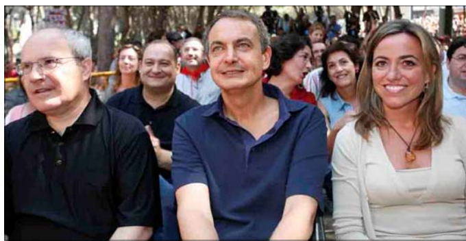
Montilla, Zapatero y Carme Chacón, en un momento de la fiesta

de los que ahora tanto hablan de Inversiones podían haberse acordado antes porque estuvieron gobernando mucho tiempo y con el gobierno de Aznar”. “Hemos gobernado y gobernaremos con honestidad, con respeto, sin insultar a nadie, aguantando las críticas, con reconocimiento pleno de la diversidad de este país, buscando siempre el encuentro”, concluyó, convencido de que “optimismo, fuerza y trabajo” son las claves para tener de nuevo “cuatro años de progreso, de desarrollo, igualdad y extensión de derechos”.